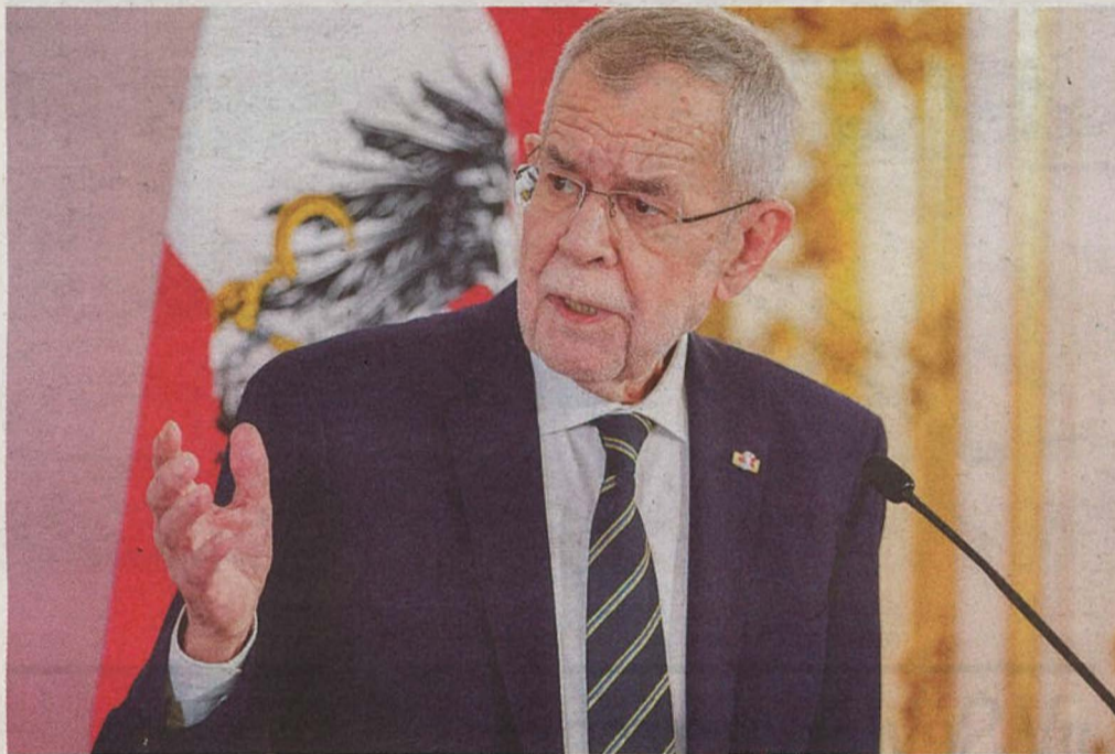
Zvezni predsednik Alexander Van der Bellen je januarja letos nastopil svoj drugi mandat